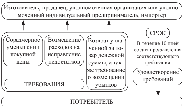
Схема 4. Порядок и сроки удовлетворения отдельных требований потребителя

ние недостатков товара потребителем или третьим лицом, возврате уплаченной за товар денежной суммы, а также требование о возмещении убытков, причиненных потребителю вследствие продажи товара ненадлежащего качества либо предоставления ненадлежащей информации о товаре, подлежат удовлетворению продавцом (изготовителем, уполномоченной организацией или уполномоченным индивидуальным предпринимателем, импортером) в течение десяти дней со дня предъявления соответствующего требования