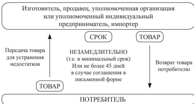
Схема 1. Порядок и сроки устранения недостатков товара

Если срок устранения недостатков товара не определен в письменной форме соглашением сторон, эти недостатки должны быть устранены изготовителем (продавцом, уполномоченной организацией или уполномоченным индивидуальным предпринимателем, импортером) незамедлительно , то есть в минимальный срок, объективно необходимый для их устранения с учетом обычно применяемого способа. Срок устранения недостатков товара, определяемый в письменной форме соглашением сторон, не может превышать срок пять дней .